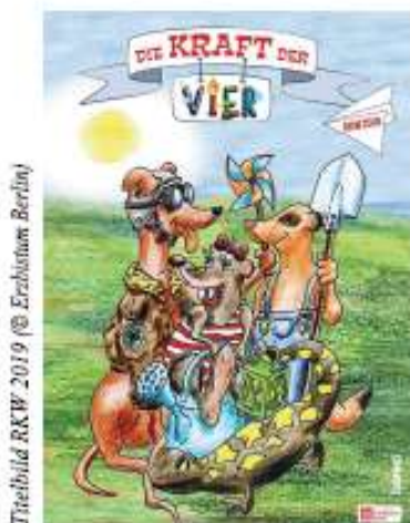
Tierbild RKW 2019