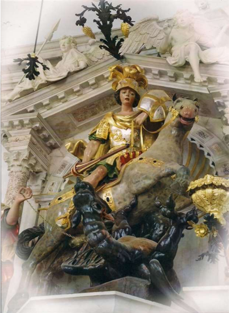
Hl. Georg von Piran - Slowenien